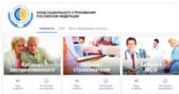
Вход в личный кабинет

Необходимым условием для входа является регистрация на Едином портале государственных и муниципальных услуг (ЕПГУ). Подробную информацию по регистрации на портале госуслуг можно найти на сайте регионального отделения http://r27.fss.ru/ в разделе «Государственные услуги регионального отделения».